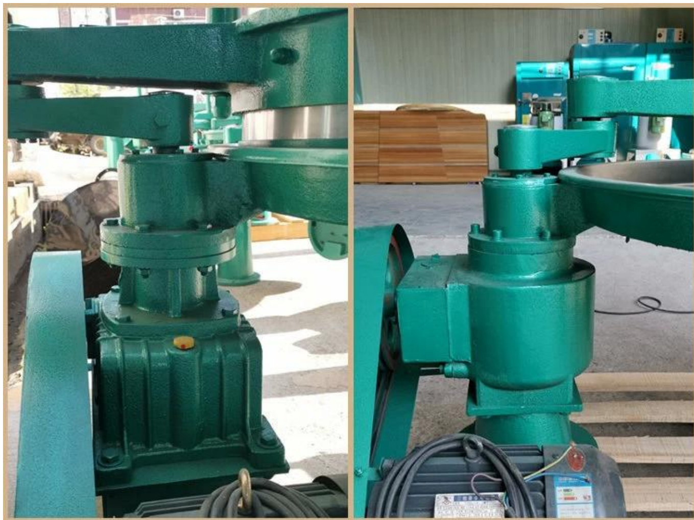
Конструкция червячного редуктора турбины, замедление стабильное и долговечное.