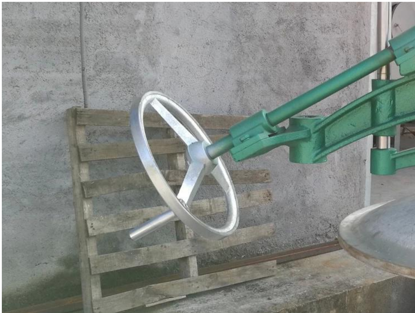
Увеличенная конструкция маховика, более быстрый подъем крышки ствола.